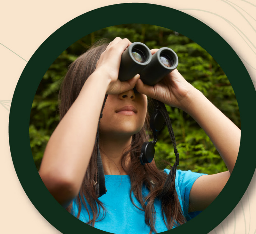
AVISTAMIENTO DE AVES