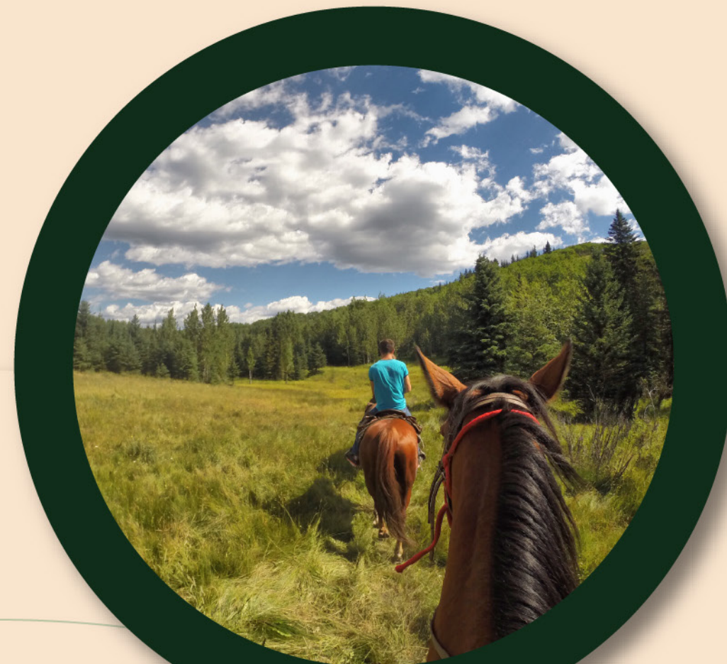
RECORRIDOS A CABALLO